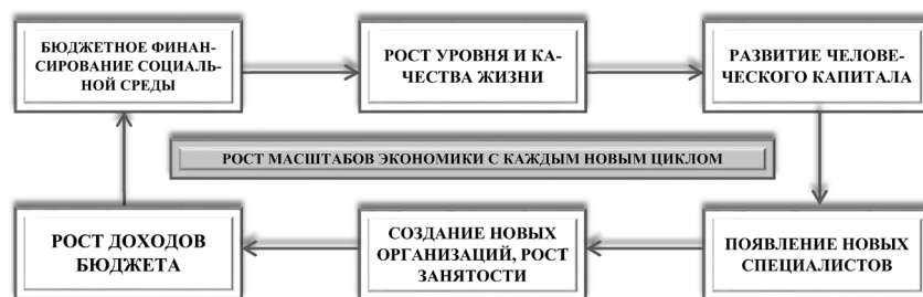
Рис. 2. Модель экономического воспроизводства в социальном секторе