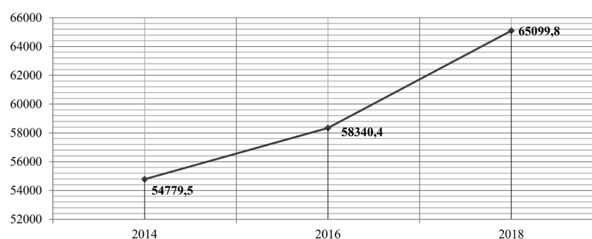
Рис. 3. Динамика совокупных объемов бюджетного финансирования социально-значимых проектов в Волгоградской области, 2014–2018 гг.

На основании вышеприведенных данных можно сделать вывод о том, что социальная сфера на сегодняшний день является одной из основных областей расходов бюджета, поскольку ее развитие способствует росту уровня и качества жизни граждан, в долгосрочной перспективе приводящему к совершенствованию россий-