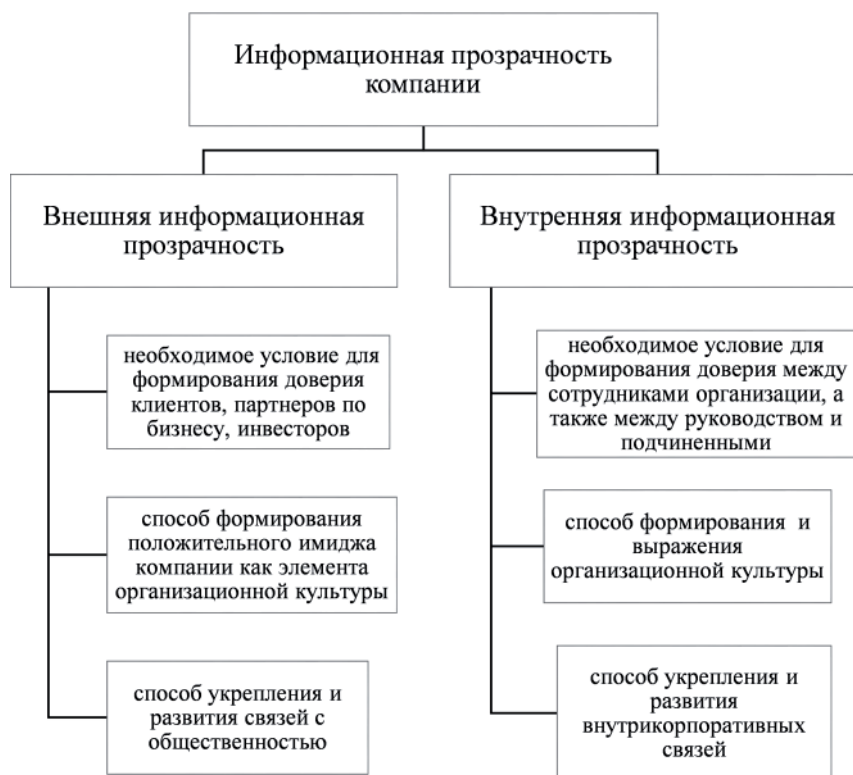
Рис. 1. Информационная прозрачность компании – один из факторов повышения конкурентоспособности компании

Информационная прозрачность формируется компанией в двух аспектах: внешнем и внутреннем. Внешняя информационная прозрачность является необходимым условием для формирования доверия контрагентов внешней среды с целью повышения конкурентоспособности компании. Также, внешняя информационная прозрачность компании способствует формированию положительного имиджа компании как элемента организационной культуры. Благодаря внешней информационной прозрачности происходит развитие и повышение качества связей с общественностью. Внутренняя информационная прозрачность направлена на формирование доверия между сотрудниками внутри организации, между руководством и подчиненным, она