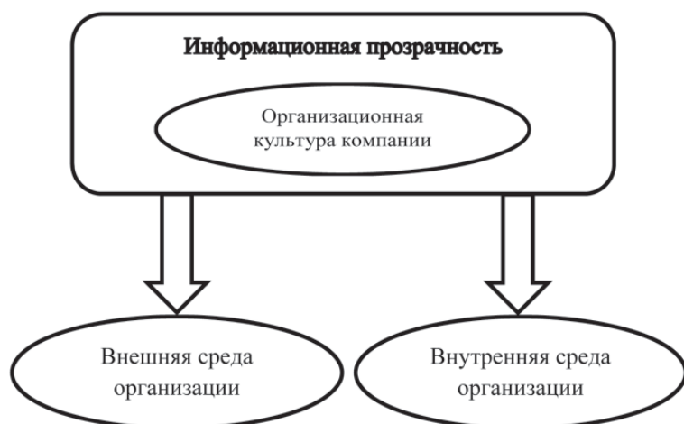
Рис. 2. Информационная прозрачность – проводник организационной культуры для внутренней и внешней среды организации

способствует укреплению и развитию отношений между структурными подразделениями, улучшению внутрикorporативного климата организации. Также внутренняя информационная прозрачность является способом формирования и выражения организационной культуры (рис. 1).