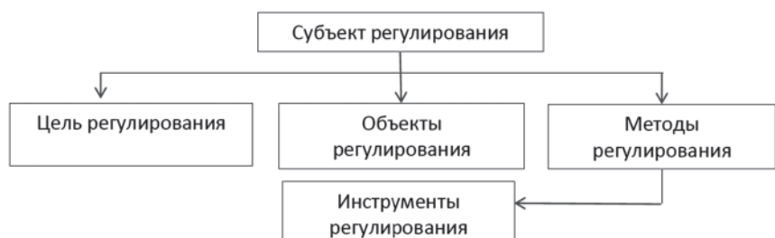
Рис. 1. Структура хозяйственного механизма отдельного субъекта

Е.С. Андрущенко относит механизм управления к более узкой категории, отмечая, что управление отражает в основном причинно-следственные связи и зависимости, возникающие в процессе коллективного труда и занимает подчиненное место по отношению к организационным формам производства. Например, организационно-правовые формы предприятий – акционер-