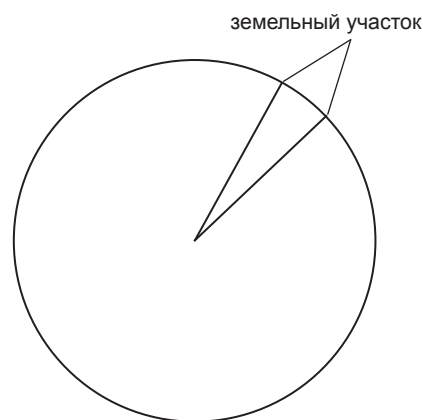
Рис. 1. Модель земельного участка

Понятие «рынок недвижимости» не имеет законодательного установления, по этой причине, приведённое ниже определение составлено на основе научных исследований и подходов к развитию, которые приняты в мировой практике.