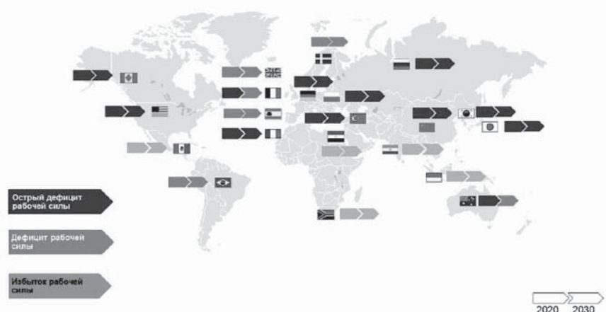
Рис. 1. Прогнозная ситуация на мировом рынке рабочей силы на 2020–2030 гг.