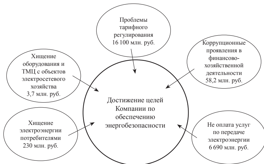
Рис. 2. Основные угрозы энергобезопасности

– возбуждено уголовное дело по ч. 4 ст. 204 УК РФ в отношении сотрудника филиала – направлено заявление о привлечении к уголовной ответственности