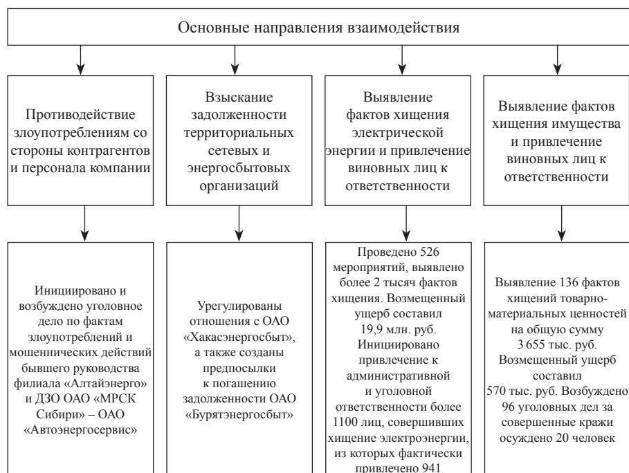
Рис. 3. Основные результаты взаимодействия филиалов с правоохранительными органами

вующее уголовное законодательство специальной нормы, предусматривающей ответственность за незаконное пользование электрической энергии с приглашением и участием представителей: Прокуратуры края, УМВД по краю, Департамента по обеспечению деятельности мировых судей, Защиты прав потребителей управления Роспотребнадзора, Региональной службы по тарифам и ценообразованию, УФАС.