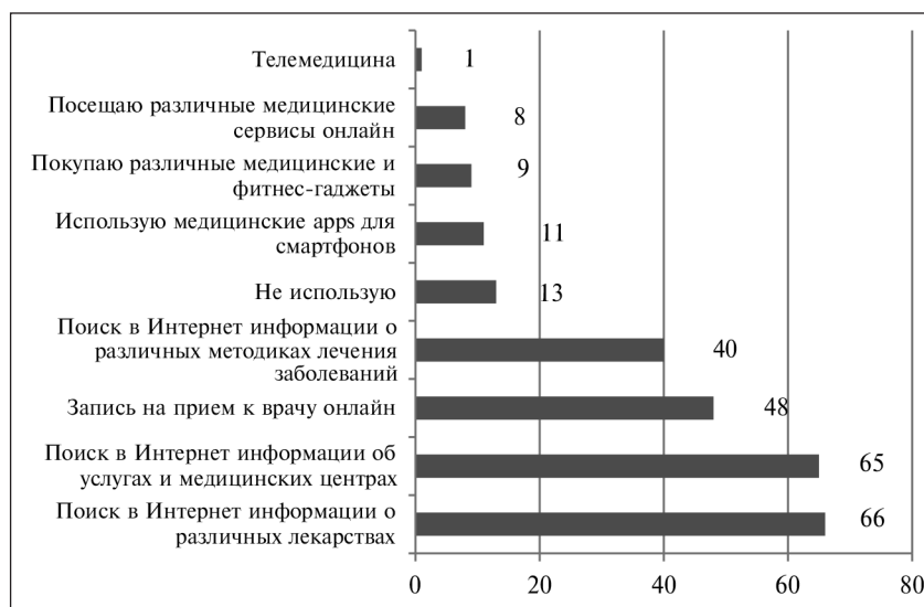
Рис. 1. Применение цифровой медицины респондентами, в %. (n = 380)

Несмотря на удобство использования такого подхода к организации опроса, после создания анкеты через систему исследователю приходится самостоятельно распространять ссылку на заполненные анкеты, что влияет на репрезентативность выборки. Основные используемые для этого каналы – электронная почта, мессенджеры, чаты и социальные сети. Эту проблему можно решить, размещая анонс с приглашением принять участие в опросе на сайтах ведущих провайдеров исследуемого рынка или при входе в популярную почтовую систему. Однако использование предложенных методов исследования не дает полной уверенности в репрезентативности данных, в достаточном количестве респондентов, попавших в выборку для проведения опроса. Когда анонс опроса размещается на