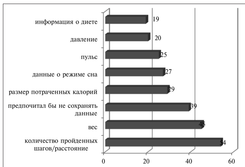
Рис. 3. Наиболее популярные среди молодежной аудитории данные о себе для сохранения в медицинских apps, в % ( n = 380 )

53% респондентов полагали, что имеют хорошее состояние здоровья – ходят к врачам эпизодически, не имеют никаких серьезных заболеваний. Отличным состоянием здоровья обладают 37% опрошенных. Они редко обращаются к врачам и посещают медицинские учреждения. Затруднились оценить свое состояние здоровья 6%. Плохим свое здоровье считает 1%. 36% из опрошенных респондентов приобретали за последний месяц какие-либо медицинские услуги.