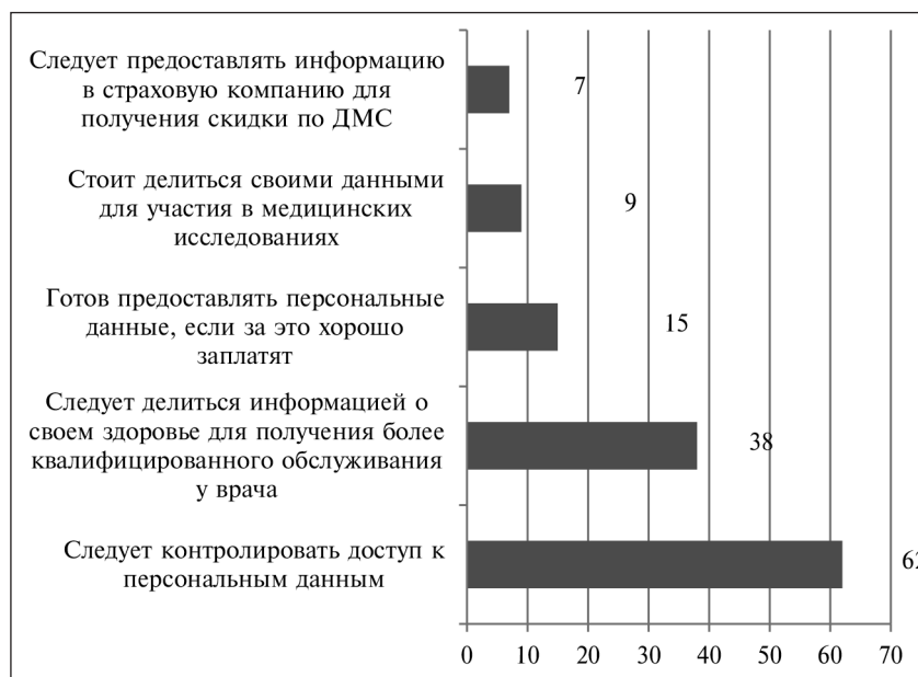
Рис. 7. Мнение относительно доступа к персональным медицинским данным, в % (n = 380)

Поскольку тренд цифровой медицины охватывает развитие облачных технологий для хранения массивов данных, а так-