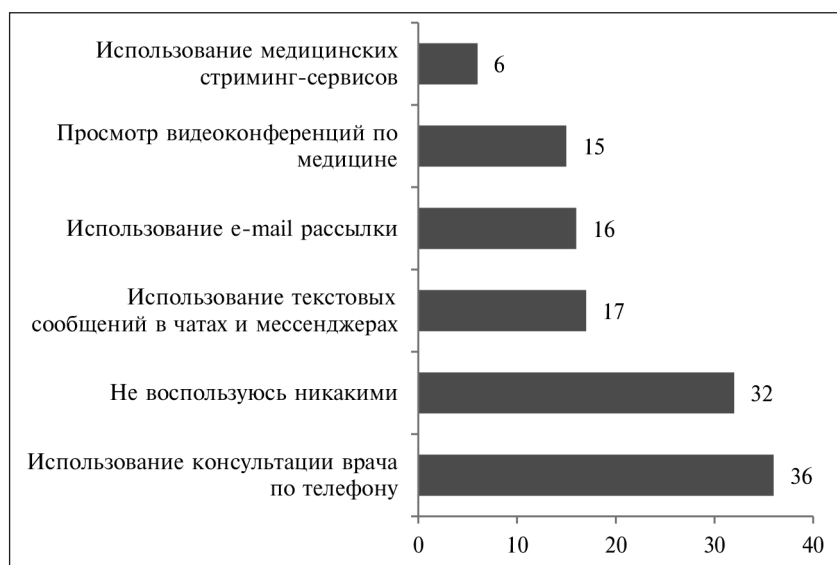
Рис. 5. Какими направлениями телемедицины могли бы воспользоваться в будущем, в % (n = 380)

В рамках проведенного исследования был задан вопрос