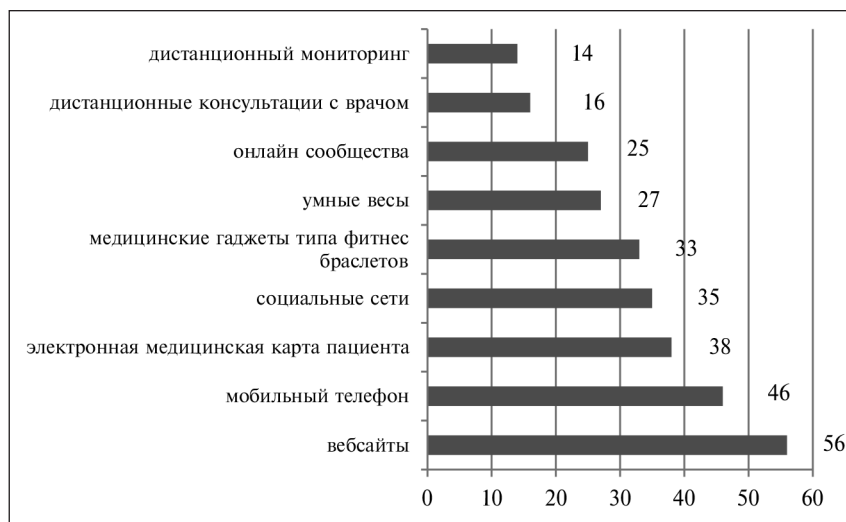
Рис. 2. Использование цифровых медицинских технологий респондентами в США в %, n = 2301 [8]

сайтах компаний, в процессе отбора респондентов задействован так называемый механизм самоотбора. То же характерно для ситуации, когда рекрутинг респондентов происходит через рекламные объявления, размещаемые в социальных сетях с настройками таргетинга по требуемым для исследования характеристикам. Это приводит к тому, что в исследовании, как правило, участвует только наиболее активная часть сетевого сообщества [4, с.235].